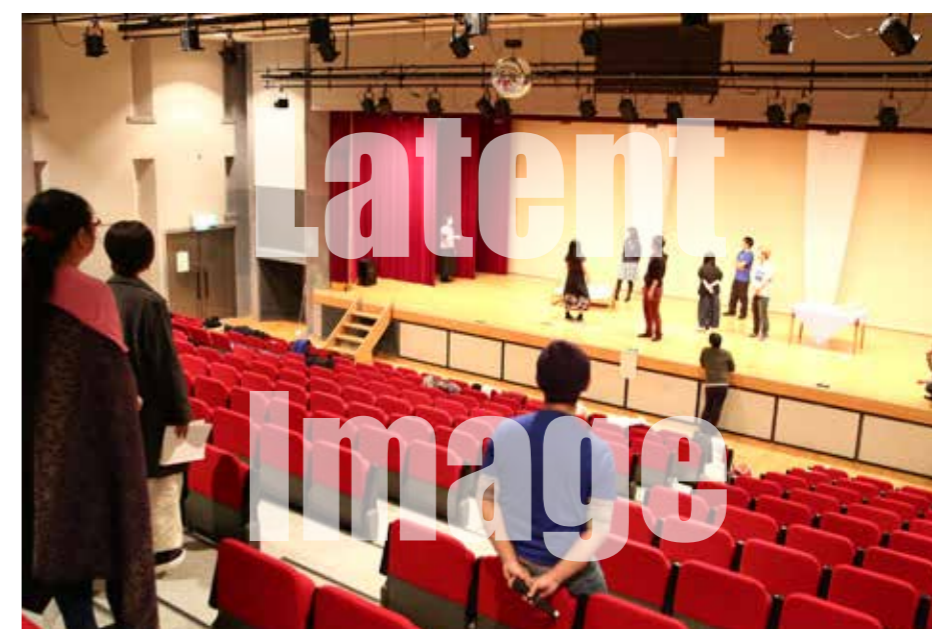
練習は夜まで続く

パンフレットを皆で手分けし、1つの冊子にまとめる。300部くらいあつただろうか？ページを順番に並べて閉じる。そしてチラシを挟む。 全て手作業だ。大道具などももちろん、全て手作り。一人一人がきちんと関わるので、一体感も感じられた。 2月23日 9:07