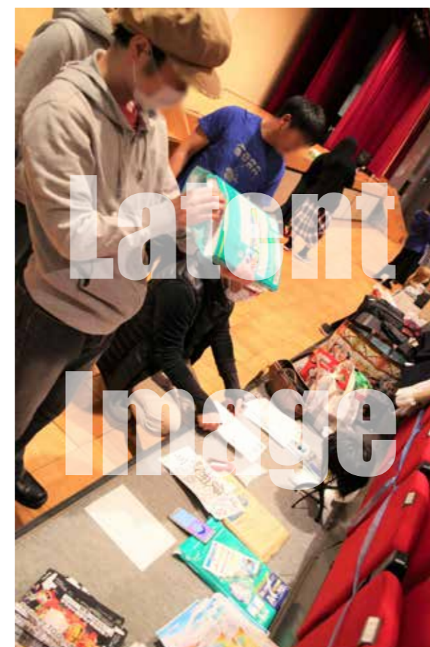
手作りのパンフレット

公演の前日には各種準備と、最終的な舞台練習がある。朝の9時に集合した。明日が舞台の本番なので、この日がとても重要になる。舞台セットやチラシ・パンフレットの準備、照明機材や音響機材のチェックも入念に行われた。 2月23日 9:03